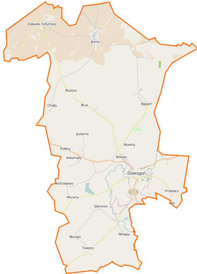
Plan gminy Dzierżon